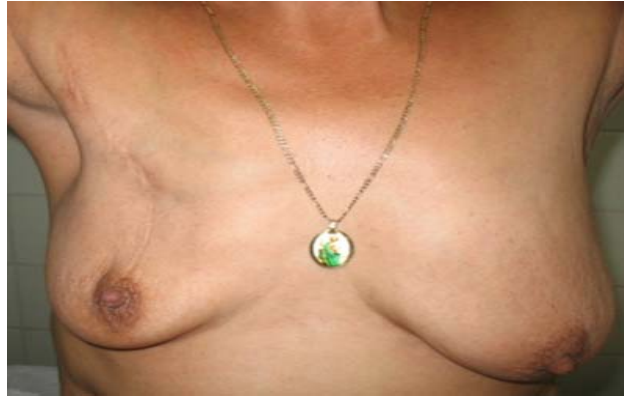
Figura 2. Cirugía conservadora con la técnica de Veronesi

Esta técnica quirúrgica fue realizada en el 21,8% de las enfermas y debiera emplearse mucho más en la población estudiada, teniendo en cuenta que la mayoría de las pacientes se encontraban en estadio II ó no tenían metástasis ganglionar axilar, y además, como plantean los textos actuales: el tratamiento quirúrgico conservador es una alternativa en el tratamiento de las etapas tempranas del cáncer mamario e incursiona hoy día en etapas más avanzadas del padecimiento, asociado en algunos casos al tratamiento neoadyuvante. 13,14