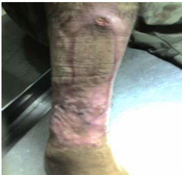
Figura 2. Lesión de salida tras autoinjerto libre de piel

El paciente fue egresado tras una estadía de 58 días, pero se mantuvo un seguimiento ambulatorio con curas de los injertos en días alternos durante dos semanas (figura 2) hasta su egreso definitivo, con posterior incorporación a su vida laboral.