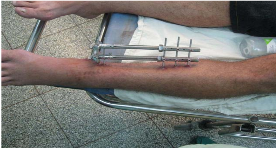
Figura 2. Fractura abierta de tibia grado II tratada con fijación monopolar doble de urgencia. Evolución a los tres meses

La importancia del costo es, cada vez, un asunto de importancia en un mundo en crisis; en Cuba, un país subdesarrollado e inmerso en múltiples cambios en el sector de la salud, el ahorro de recursos y de bienes constituye uno de los pilares de los lineamientos económicos actuales, por lo que una menor estadía y un mínimo de recursos y medicamentos utilizados en la mayoría de los casos son las pautas del tratamiento para la colocación de este método de fijación de urgencia. 18