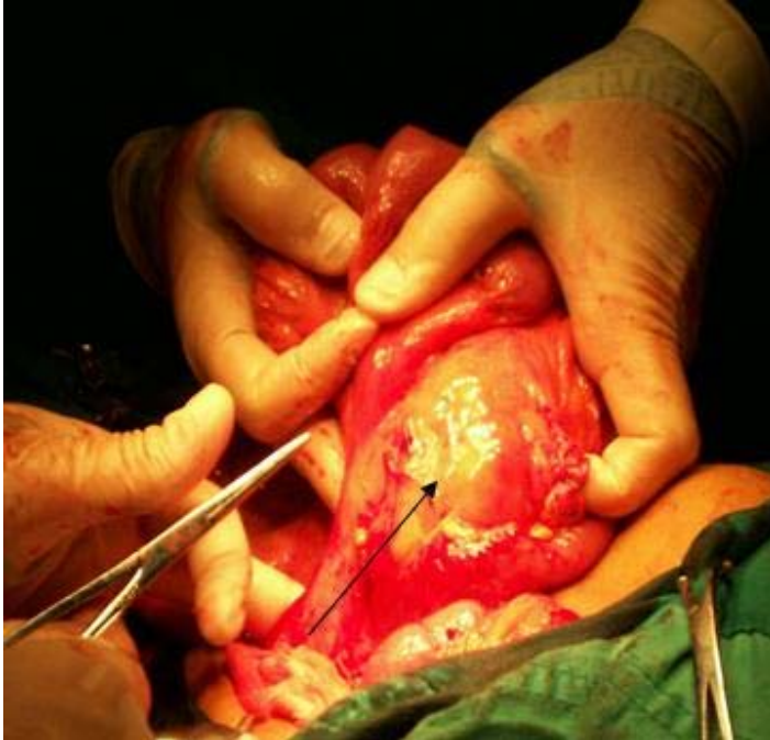
Figura 1. Se observa el tumor de color blanco amarillo (flecha) localizado en el mesenterio del yeyuno, cerca del ángulo duodeno-yeyunal

El paciente evolucionó satisfactoriamente y fue egresado al sexto día del postoperatorio.