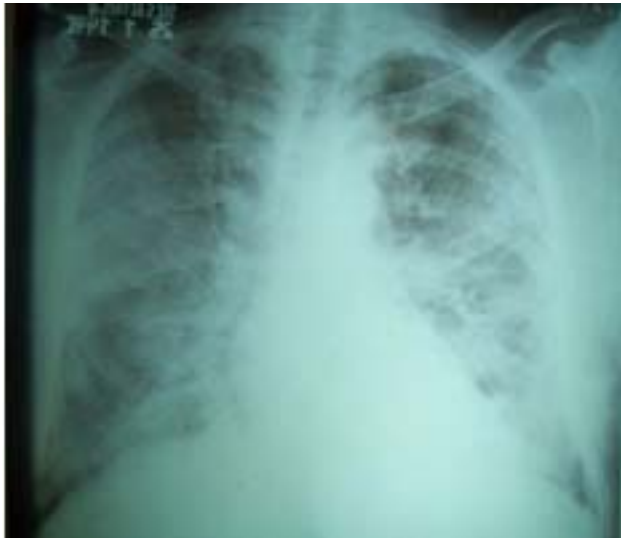
Figura 1. Radiografía de tórax. Patrón de infiltrado alveolar bilateral

derecho (figura 2) -etiológicamente de posible enfermedad bulosa pulmonar-; después de haber descartado algún traumatismo o un postcatéter venoso central (o ambos) se le realizó una pleurotomía mínima alta con aspiración continua por sistema de Over Holt. Esta complicación no tuvo una evolución satisfactoria y aparecieron signos de sepsis por neumonía necrotizante con empiema por pseudomona confirmado en cultivos del líquido pleural y esputo bacteriológico y en una tomografía axial computadorizada contrastada (figura 3).