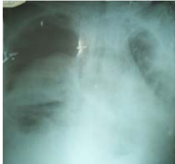
Figura 2. Radiografía de tórax. Neumotórax derecho