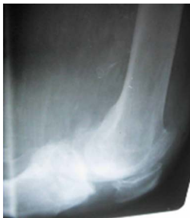
Figura 4. Rx defecto óseo tibial vista lateral