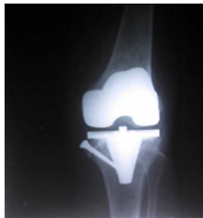
Figura 5. Rx posoperatorio tibial vista AP