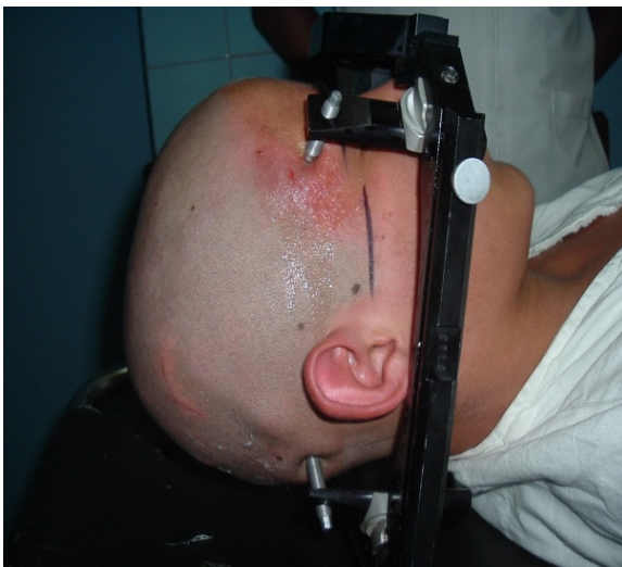
Figura 1. Colocación del anillo estereotáxico

Después de trasladado el paciente hacia la Unidad de Radiología (al tomógrafo helicoidal computadorizado -Somaton-) se acopla el anillo estereotáxico a la mesa del tomógrafo mediante un adaptador que garantiza su fijación y se coloca el sistema de referencias estereotáxicas. Terminado el estudio las imágenes se transfieren a la computadora de la estación de planificación en la unidad quirúrgica con la utilización del software Patris (EICISOFT, Cuba) -figura 2-.