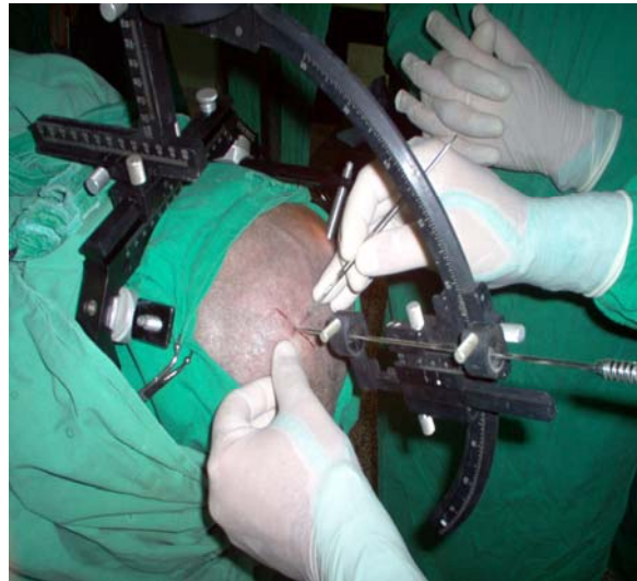
Figura 4. Planificación del abordaje quirúrgico