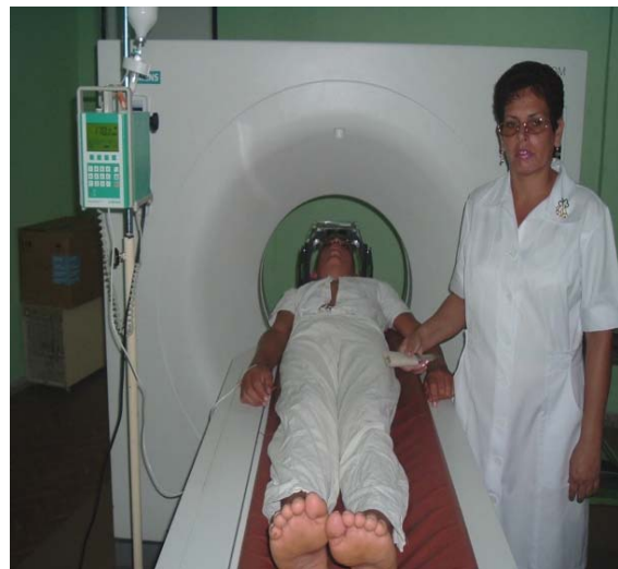
Figura 2. Obtención de imágenes estereotáxicas con el auxilio del Somatón helicoidal