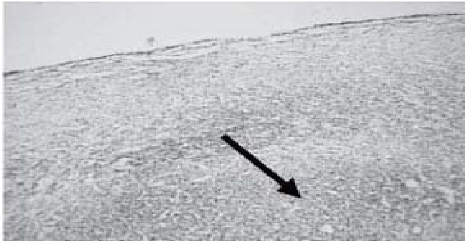
Figura 3. Imagen histológica (la flecha muestra las cavidades con algunos eritrocitos en su interior)