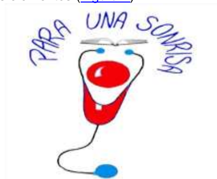
Figura 1. Logotipo de la metodología.

Logotipo: el Estetoyaso, que posee diversos elementos: el estetoscopio, símbolo de la medicina; el libro en la ceja, de la educación; el payaso, de la cultura; el pelo, nombre de la metodología, simboliza la unidad de todos los elementos ( Figura 1 ).