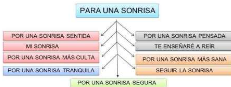
Figura 3. Programas que conforman la metodología.

Para la capacitación se crearon las siguientes herramientas.