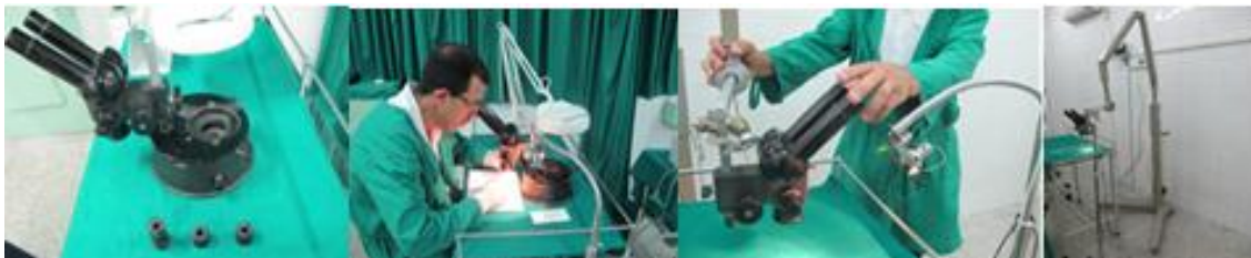
Figura 3. Microscopio estéreo preparado y adaptado para microcirugía experimental, y microscopio operatorio acoplado a brazo de rayo X de equipo de Estomatología.