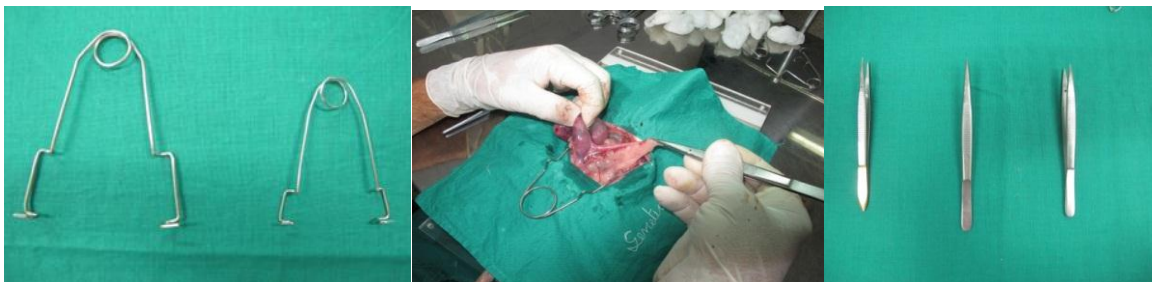
Figura 7. Separadores auto-estáticos para tratamiento quirúrgico confeccionados a partir de cables de ortopedia desechables. Pinzas de micro disecciones fabricadas a partir de pinzas de disección desgarradas en sus puntas.