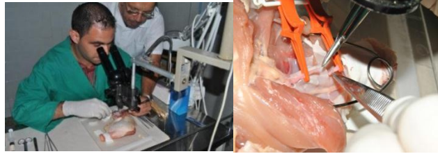
Figura 9. Modelo «pollo» (Modelo inanimado biológico) en técnicas experimentales de microcirugía vascular y nerviosa.

El gimnasio quirúrgico contribuyó al montaje y funcionamiento del aula-laboratorio. Está conformado por cuatro niveles en el proceso de enseñanza-aprendizaje y tiene un funcionamiento dinámico, participativo e interactivo.