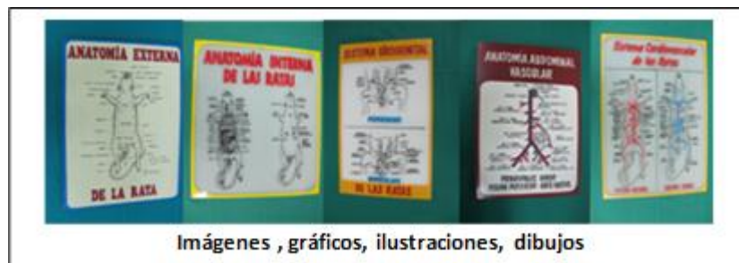
Figura 1. Dibujos, imágenes, gráficos, ilustraciones en láminas de cartón y acrílico.