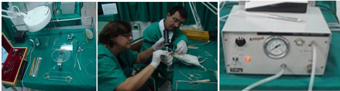
Figura 5. Recuperación de paquete de diagnóstico de ojo, oído, nariz y laringe para la intubación endotraqueal de ratas. Recuperación de ventilador mecánico Ealing para intubación endotraqueal.