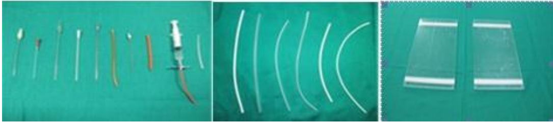
Figura 2. Cánulas, catéteres, sondas pequeñas innovadas y adaptadas para intubación esofágica y endotraqueal en roedores de laboratorio, catéter de derivación ventrículo peritoneal y tabillas de acrílico para microdissección.