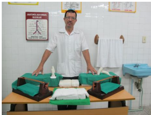
Figura 8. Gimnasio quirúrgico conformado de variadas maquetas que funcionan como simuladores inanimados sintéticos.