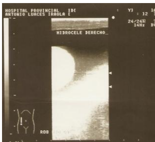
Figura No. 1. Hidrocele derecho.