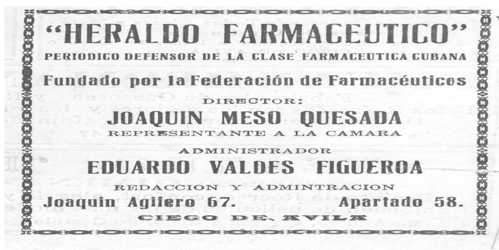
Propaganda sobre el periódico Heraldo farmacéutico. Álbum Rojo p. 73