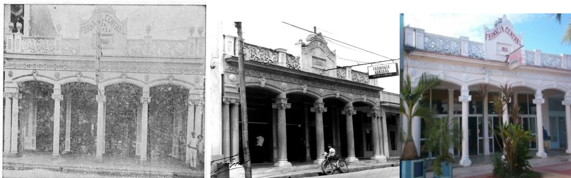
La Farmacia Central de 1930, 1960 y 2013.