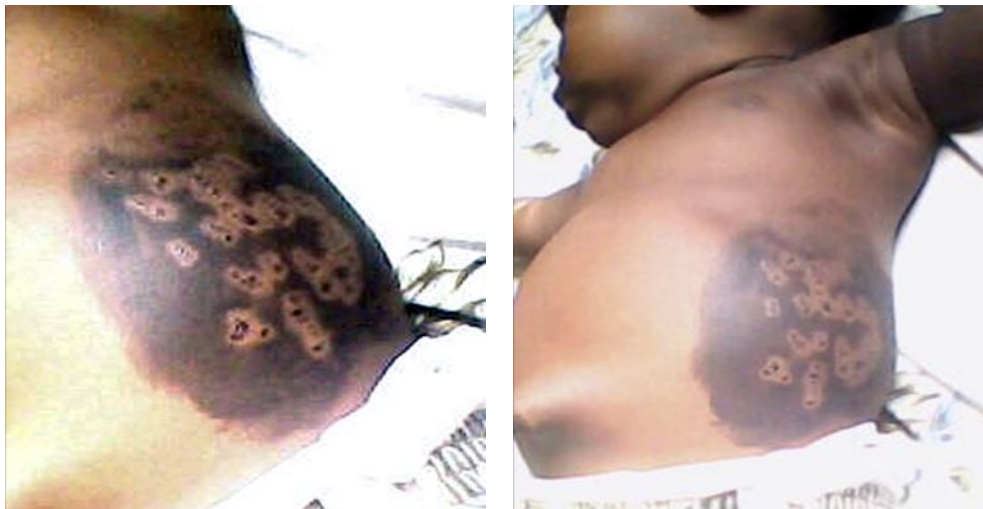
Paciente de 7 meses, masculino. Escarificaciones en pared abdominal. Medicina Tradicional: Tratamiento del bazo inflamado. (Paciente ingresado por Paludismo y Anemia).