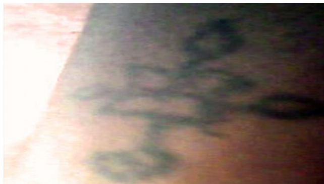
Figura No.1. Tatuajes decorativos.

Paciente de 23 años, femenina. Tatuaje realizado en la pierna derecha por interés decorativo en la adolescencia.