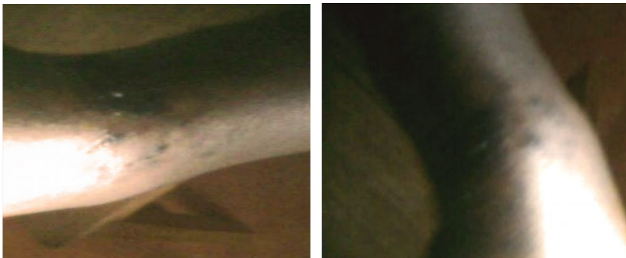
Paciente de 5 años de edad. Escarificaciones realizadas en antebrazo derecho como tratamiento de fractura del miembro.