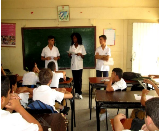
Fig. 2 – Estudiantes en audiencia sanitaria.

secundarias y preuniversitarios donde, con la utilización de técnicas participativas en dependencia de la edad y contexto de los participantes, se divulgaron aspectos generales sobre el cáncer, su prevención, síntomas y signos de alarma (Fig. 2 y Fig. 3).