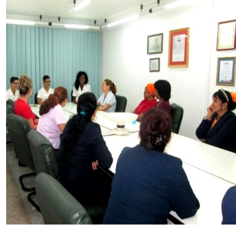
Fig. 3 – Profesores en audiencia sanitaria.

I.3. Realización de matutinos especiales. Los integrantes del proyecto realizaron un total de 30 actividades de este tipo, durante las fechas alegóricas al cáncer como enfermedad crónica, su prevención y diagnóstico temprano, con el lema “lucha contra el cáncer”.