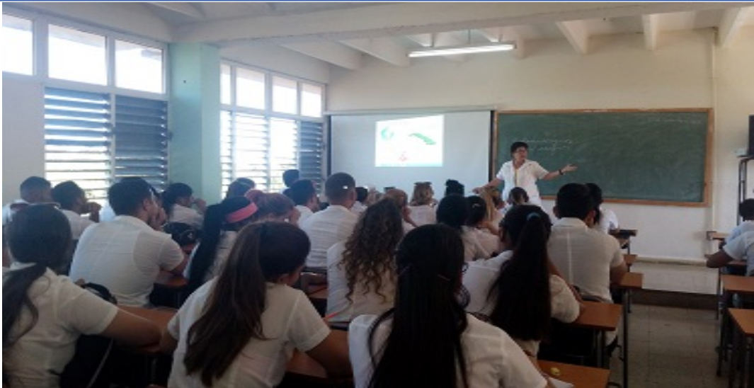
Fig. 5 – Curso optativo “Cáncer y medicina natural y tradicional”.

Se diseñó un curso y un diplomado de oncohematología; el primero para médicos de la APS y el segundo para especialistas en medicina general integral y pediatras. Ambos se programaron para el segundo semestre de 2020.