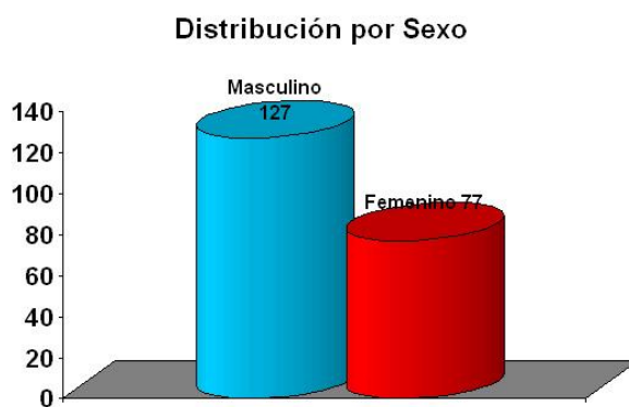
Gráfico 1. Distribución según grupo de edad y sexo.