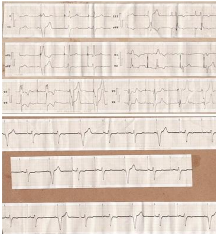
Figura 1. Electrocardiograma, estimulación compatible con marcapasos bicameral

En el electrocardiograma realizado se observó estimulación compatible con la de un marcapasos bicameral, es decir, espiga auricular y además electrostímulo ventricular con prolongación del intervalo A-V. (Figura 1)