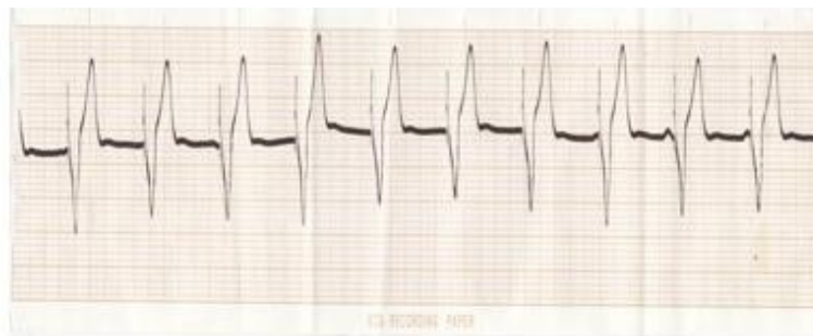
Figura 3. Electrocardiograma, correcta estimulación VVI

Posteriormente se implantó un nuevo electrodo a nivel de la punta del ventrículo derecho y se conservó el mismo generador. Se realizó electrocardiograma de superficie que muestra correcta estimulación VVI. (Figura 3)