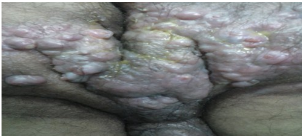
Figura 1. Afectaciones perineales con la presencia de abscesos fistulosos al dejar múltiples trayectos catalogados como fístulas complejas.