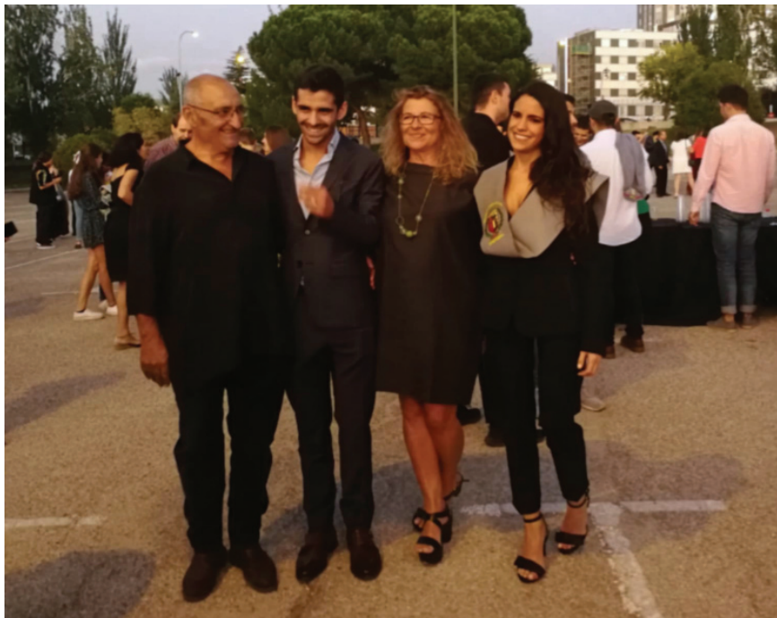
Con la familia, tras el acto de graduación

Y aquí empieza la historia de este testimonio. Yo, como otros tantos, me he convertido en "sanitaria frente al COVID". Lo cierto es que me siento afortunada en relación con otros compañeros: soy joven, no me han cambiado de unidad ni de hospital al empezar la reorganización en la pandemia, conocía la UCI y a los compañeros, sabía (desde mi corta experiencia) cómo trabajar, cómo funcionaba el equipo, cómo eran los pacientes de UCI, las medicaciones, los respiradores... La capacitación en EPI (Equipo de Protección Individual) la hice con al menos una semana de antelación al primer caso que traté. Esto parecería lo mínimo a cumplir para trabajar bien, disminuir los riesgos hacia el paciente y hacia nosotros mismos, pero en realidad duró esa semana y actualmente algo así sería un regalo. Todo esto me hace sentir en una situación privilegiada y soy consciente de ello, pero espero, con estas pocas líneas, poder dar voz a muchos de mis compañeros y sus bien distintas situaciones.