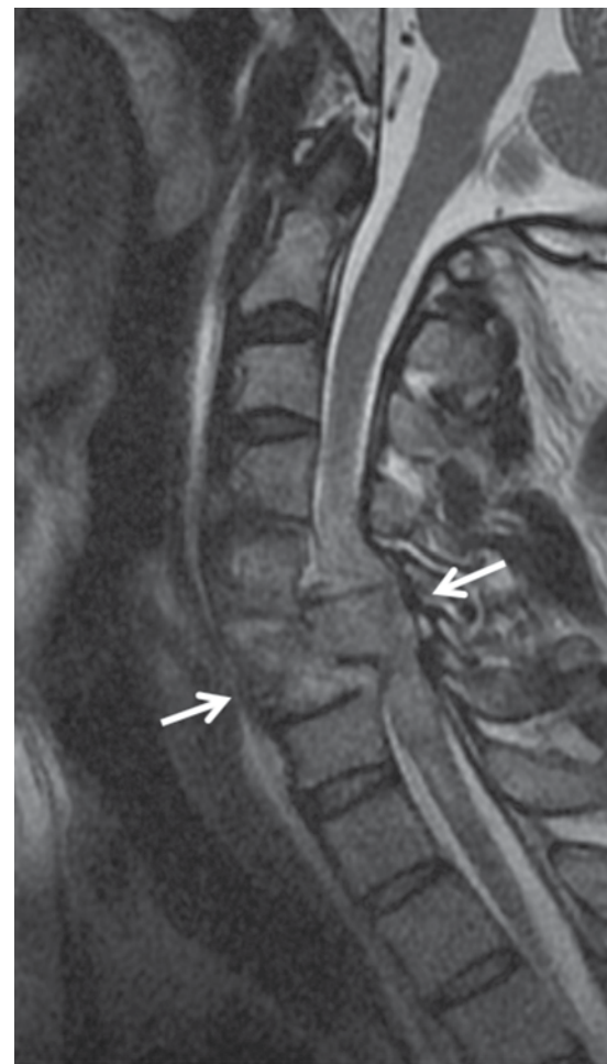
Figura 1. Corte sagital T2 que muestra una fractura conminuta de los cuerpos vertebrales C6-C7 con retrolistesis que reduce en 95% el canal medular y que genera lesión en la médula espinal (flecha).

columna cervical evidenció fractura de C6-C7 con retrolistesis y compresión del canal medular (Figura 1). Por lo anterior se ingresó a la Unidad de Terapia Intensiva, donde se dio tratamiento con reanimación e infusión de esteroides. Durante su estancia en la Unidad de Terapia Intensiva tuvo hipertensión arterial sistémica y poliuria. Los exámenes de laboratorio mostraron hiperfiltración de proteínas. La urea, creatinina