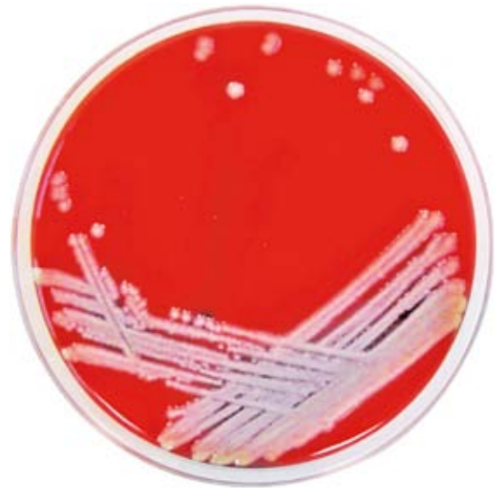
Figura 1. Aeromonas hydrophila en agar sangre.

Cerca de 90% de las cepas tienen \beta hemólisis. Los sistemas comerciales para la identificación de la bacteria son de buena calidad; sin embargo, es de suma importancia identificar los potencia-