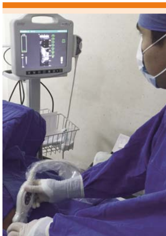
Figura 3. Inserción de un catéter venoso central en la vena yugular derecha bajo guía con ultrasonido en tiempo real. La imagen muestra la posición del transductor del ultrasonido en tiempo real y la aguja respecto a la clavícula y el músculo esternocleidomastoideo.

realizó prueba t de Student para comparación de medias; para análisis bivariado de variables cuantitativas se utilizó \chi^2 (o prueba exacta de Fisher, según el caso) y se analizó la razón de momios de éstas.