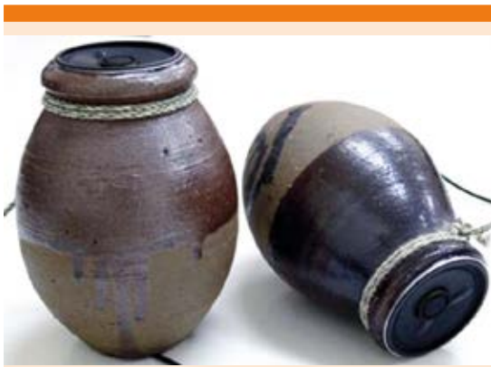
Figura 1. Trampa utilizada en Japón para atrapar pulpos llamada takotsubo , de donde se tomó el nombre del síndrome por la semejanza morfológica que adopta el ventrículo izquierdo con la vasija.

al aire ambiente de 80%. En los exámenes paracĺnicos se reportaron leucocitos de 5,400/mcL con desviaci3n a la izquierda y procalcitonina en 13 ng/dL. La prueba r3pida de influenza fue negativa. Los resultados gasom3tricos fueron: pH de 7.35, PaCO 2 de 47 mmHg y PaO 2 de 55 mmHg. En la radiografía simple de t3rax se corrobor3 condensaci3n basal derecha; el electrocardiograma inicial indic3 ritmo sinusal sin alteraciones en la conducci3n y repolarizaci3n normal. Se integr3 el diagn3stico de neumonía grave adquirida en la comunidad, por lo que se decidi3 su hospitalizaci3n. Durante ese periodo se agrav3 la insuficiencia respiratoria y la hipoxemia, adem3s sufri3 hipotensi3n resistente a manejo con lquidos. Se integr3 el diagn3stico de choque s3ptico y se le ingres3 al servicio de terapia intensiva, en donde se le realiz3 estudio ecocardiogr3fico que revel3 hipertrofia ventricular izquierda con adecuada contractilidad global y segmentaria, y fracci3n de eyecci3n de 65%, con funci3n ventricular derecha normal. El manejo consisti3 en ventilaci3n mec3nica invasiva, nutrici3n enteral, vancomicina y flucanazol con base en los resultados de cultivos de secreci3n bronquial, que fueron Candida albicans y Staphylococcus aureus , as3 como apoyo