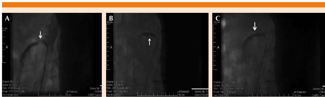
Figura 2. Angiografía de la arteria mesentérica superior. A. Estenosis crítica en el origen de la arteria mesentérica superior. B. Angioplastia con colocación de stent . C. Se corrobora adecuado paso del material de contraste sin lesión residual posangioplastia.