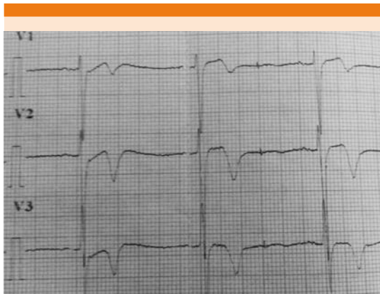
Figura 1. Trazo electrocardiográfico de derivaciones precordiales V1, V2 y V3, con criterios electrocardiográficos de síndrome de Wellens (afección en derivaciones precordiales, sin onda Q, sin alteración del segmento ST, con inversión de la onda T simétrica y profunda).

El síndrome de Wellens es un síndrome electrocardiográfico descrito inicialmente en 1982 por Zwaan y colaboradores, de un total de 145 pacientes con datos de angina inestable, 18% no mostró alteraciones en el segmento ST ni cambios en el complejo QRS; sin embargo, se encontró inversión de las ondas T de las derivaciones precordiales, esa inversión formaba un ángulo de 90° respecto a la isoeletrica, principalmente a nivel de V2 y V3. A estos pacientes se les realizó un estudio angiográfico para visualización de coronarias que mostró oclusión de la descendente anterior izquierda con oclusión crítica mayor de 90%, con posterior infarto anterior extenso en caso de no realizar intervencionismo coronario ( Figura 2 ).