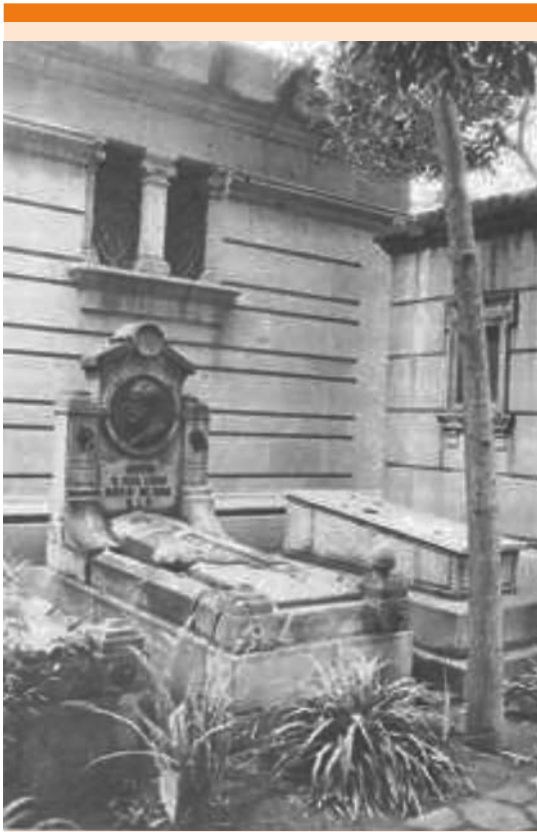
Figura 2. Tumba de Rafael Lucio Nájera.