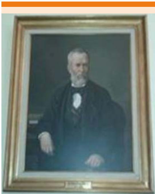
Figura 5. Retrato de Rafael Lucio Nájera.

Murió en la Ciudad de México (calle del Águila núm. 25, altos), el 30 de mayo de 1886, a las 11:45 horas, a los 66 años, de aterosclerosis arterial reblandecimiento cerebral; 37 fue enterrado al día siguiente, en el panteón del Tepeyac ac . 2,9,10