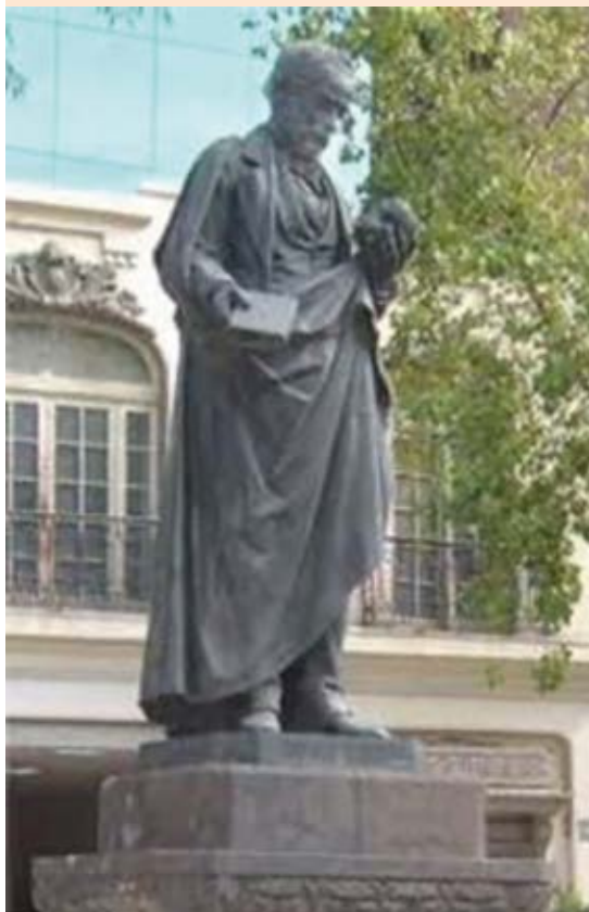
Figura 3. Estatua de Rafael Lucio Nájera.

en los pacientes que experimentan el fenómeno de Lucio-Latapí. 1,2,9,29,30 El Opúsculo es “una excelente y completa descripción clínica y de anatomía patológica macroscópica por aparatos y sistemas, con una interpretación de la patogeneia, conceptos terapéuticos y epidemiológicos, que se adelantaron a su época y que continúan vigentes”. 21