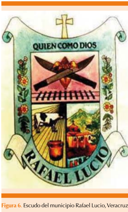
Figura 6. Escudo del municipio Rafael Lucio, Veracruz.

cotidianas de la Academia y en 2008 se bautizó con su nombre a las oficinas y salas, en donde se edita la Gaceta Médica de México. 6,11,40