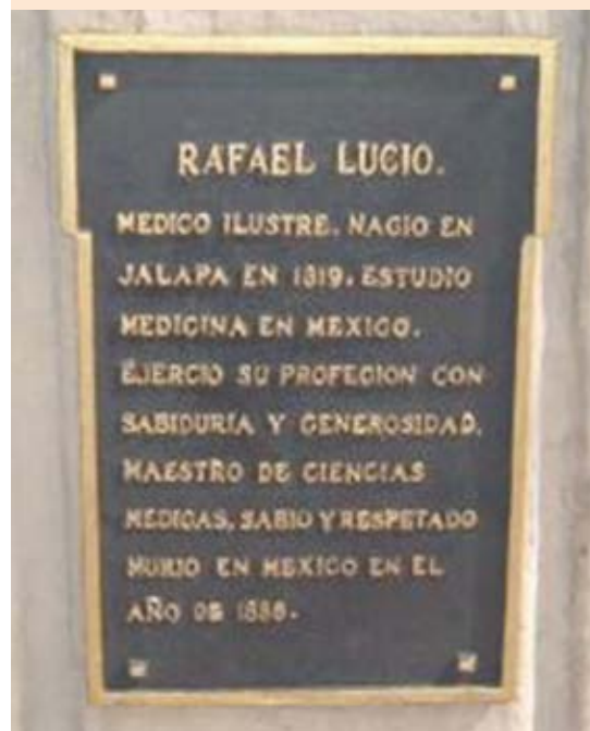
Figura 4. Pedestal de la estatua de Rafael Lucio Nájera.