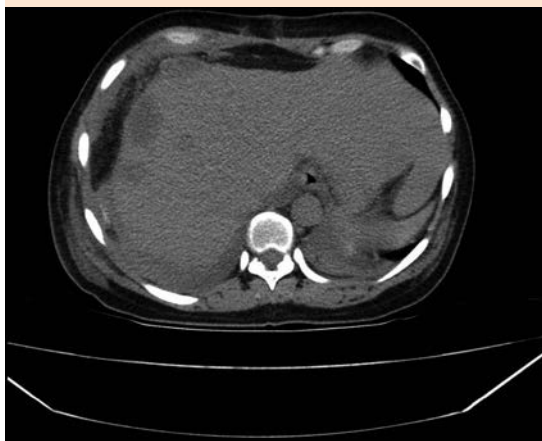
Figura 3. Tomografía axial computada abdominal pos-drenaje quirúrgico, que muestra hematomas hepáticos subcapsulares agudos y subagudos con disminución de tamaño.

Cuadro 1 muestra los estudios de laboratorio efectuados desde su traslado hasta su egreso de terapia intensiva.