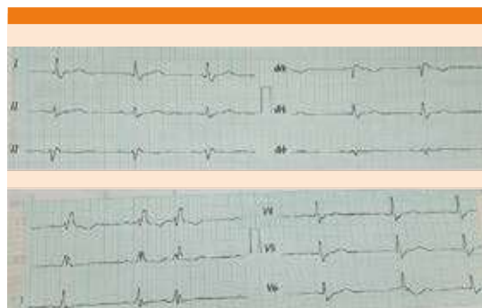
Figura 2. Electrocardiograma posterior al tratamiento.

el primer paso del abordaje. Partiendo de ello, y en caso de depresión ventilatoria, deben iniciarse ventilaciones mediante bolsa y mascarilla manteniendo adecuada oxigenación e incluso considerar la intubación endotraqueal; a menos