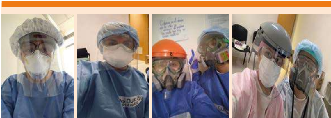
Figura 3. Residentes de la UNAM en la línea de batalla de la pandemia por COVID-19.

A pesar de las vicisitudes que han pasado los residentes durante esta pandemia, los ha motivado para continuar en la atención médica a pacientes infectados por coronavirus y seguir con sus programas académicos de manera virtual a