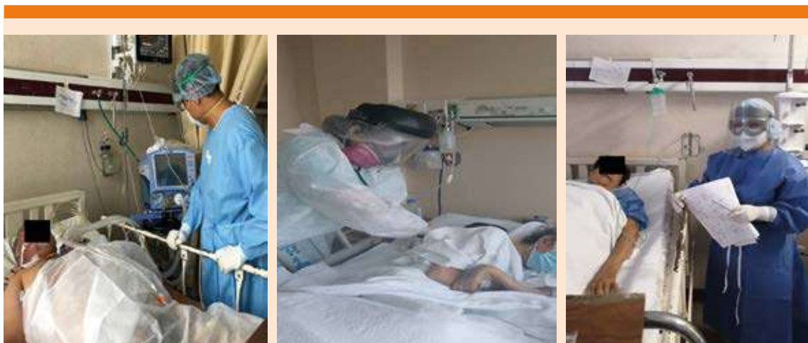
Figura 4. Residentes en la primera línea de batalla de la pandemia por COVID-19.