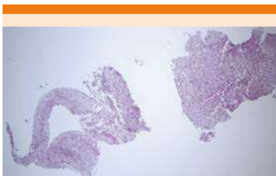
Figura 1. Panorámica del material de biopsia que muestra un vaso de pared gruesa incompleta del lado izquierdo adyacente a tejido hepático normal (HE x 4).

Los criterios EASL recomiendan establecer el diagnóstico con estudios no invasivos o estudios patológicos en pacientes con cirrosis; sin embargo, en pacientes sin cirrosis (como el caso de