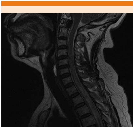
Figura 1. Hiperintensidad de cordón medular de C6-T6.

La punción lumbar reportó pleocitosis con 40 células y 65% de mononucleares, glucosa 85 mg/dL, proteínas 150 mg/dL, bandas oligoclonales ausentes.