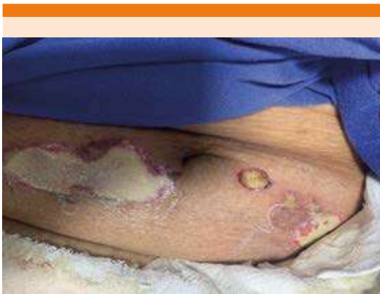
Figura 2. Lesiones metastásicas, numulares y elípticas, aisladas y coalescentes, por V. vulnificus en el abdomen.