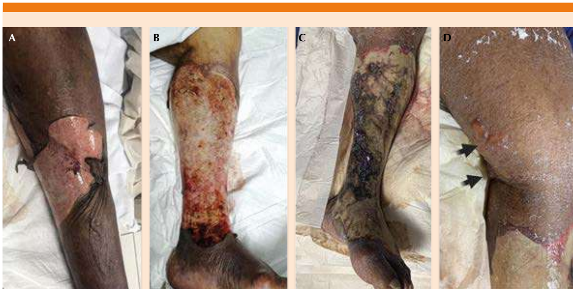
Figura 1. A. Flictena con extensa exulceración en la pierna izquierda, aspecto al ingreso a sala de medicina interna. B. Aspecto de la lesión en la pierna derecha derivada de la flictena descrita a las 24 horas C. Extensa escara en la pierna izquierda a las 72 horas de ingreso. D. Nuevas flictenas a tensión en la parte posteromedial inferior del muslo y la cara posterior de la rodilla izquierda.

La evolución clínica posterior al cambio de antibióticos fue hacia la mejoría, con normalización de la cuenta leucocitaria, remisión de la lesión renal y retiro de aminas vasoactivas. A pesar del progreso hacia el alivio, durante el día 10 de internamiento la paciente tuvo muerte súbita de origen cardíaco.