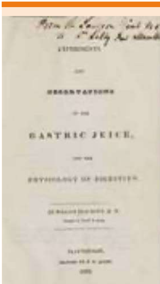
Figura 2. Portada del libro de W Beaumont.