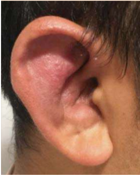
Figura 1. Pabellón auricular derecho sensible, eritematoso y edematoso, con preservación del lóbulo.

contra citoplasma de neutrófilos (ANCA) con patrón c-ANCA 1:20 (referencia < 1:20), anti-mieloperoxidasa de 2.8 U/mL (referencia < 2 U/mL), anticuerpos antinucleares (ANAS) 1:320 con patrón citoplasmático, anticuerpos contra virus de hepatitis B, C y VIH negativos. La prueba de VDRL y la prueba de absorción de anticuerpos treponémicos fluorescentes (FTA-ABS) fueron positivas. La tomografía computada mostró aumento del volumen del pabellón auricular y conducto auditivo externo derecho, desviación del cartílago nasal y engrosamiento traqueal con estriación de la grasa mediastinal ( Figura 2 ). El ecocardiograma transtorácico mostró insuficiencia mitral ligera, con leve engrosamiento de sus valvas. La valoración por oftalmología reportó escleritis difusa bilateral.