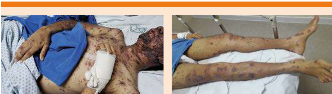
Figura 1. Dermatitis en la cara, tipo pápulas eritematosas, que posteriormente se diseminaron a la región torácica, las extremidades y el abdomen, con lesiones necróticas, sin afectar las manos ni las plantas.

lesión renal, misma que se corrigió a las 24 horas de su hospitalización.