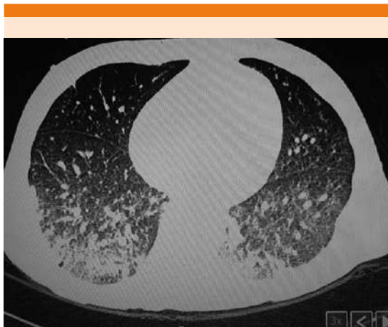
Figura 3. Estudio tomográfico de tórax que muestra un patrón retículo-nodular difuso, predominantemente en la zona posterior y las bases de ambos pulmones, con zonas de atelectasias.

CD+4: 14 células, cuenta CD+8: 16 células, perfil TORCH negativo, VDRL negativo.