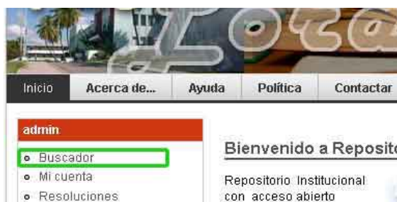
Fig 2. Buscador de documentos

Al hacer clic sobre el enlace o buscador se entrará a una página donde se encuentran todos los documentos almacenados en la base de datos, ordenados por fecha, de manera que los primeros que se muestran son los últimos que se publicaron.