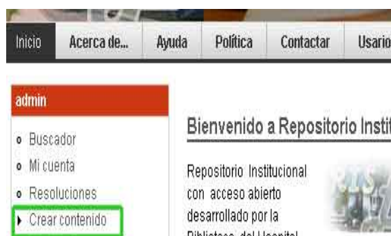
Fig 4. Depósito de documentos

Se da un clic en esta opción y se muestra una página con los enlaces para crear el tipo de documento que se desea. Luego aparece un formulario con todos los campos que se exigen para la publicación; cada campo tiene un texto de ayuda que indica cómo llenarlo. Como parte de la creación del documento uno de los campos del formulario será el artículo a texto completo y en formato PDF (obligatorio), que no podrá exceder de 8 mb. Por último se hará clic en el botón guardar que aparece al final, así el documento queda pendiente de publicación por los administradores y editores del sistema RISLora, de manera que antes de su divulgación serán revisados para su aprobación.