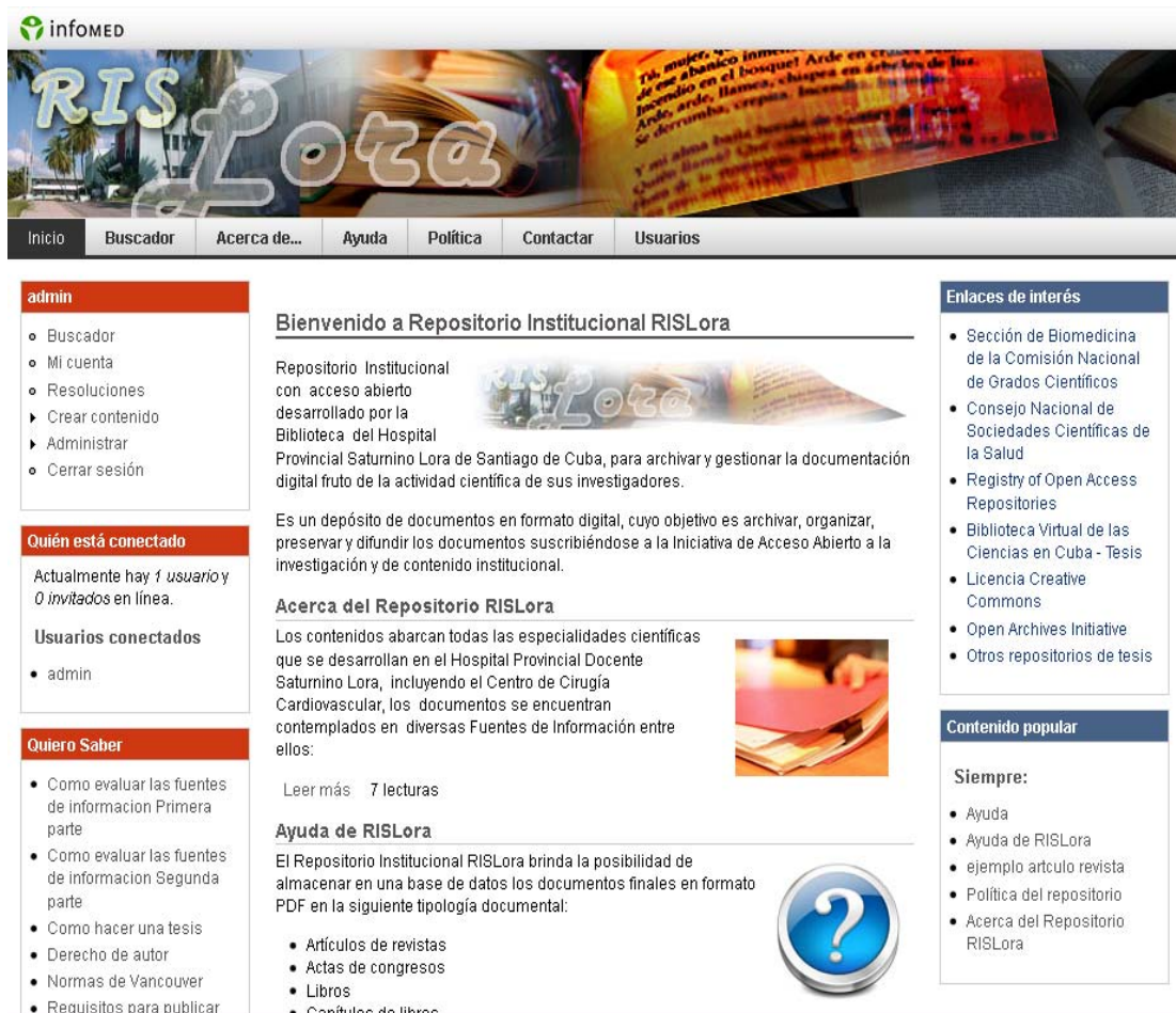
Fig 1. Repositorio institucional RisLora