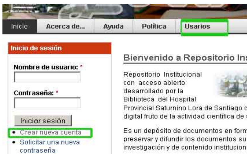
Fig 5. Depósito de documentos

Para solicitarlo se hará un clic en cualquiera de estos 2 enlaces (figura 5):