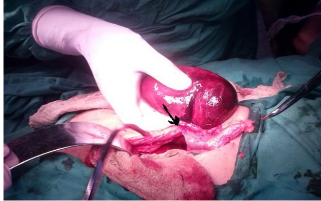
Fig 2. Vesícula biliar volvulada (la flecha indica el sitio de la torsión)