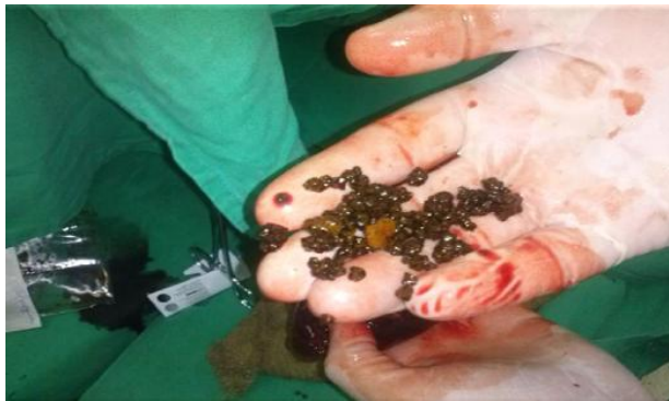
Fig 3. Contenido de la vesícula (múltiples cálculos)