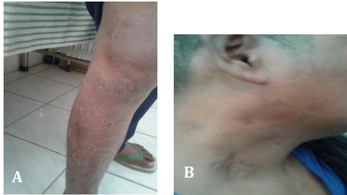
Fig. 2 A-B. Mejoría del paciente luego de aplicado el tratamiento