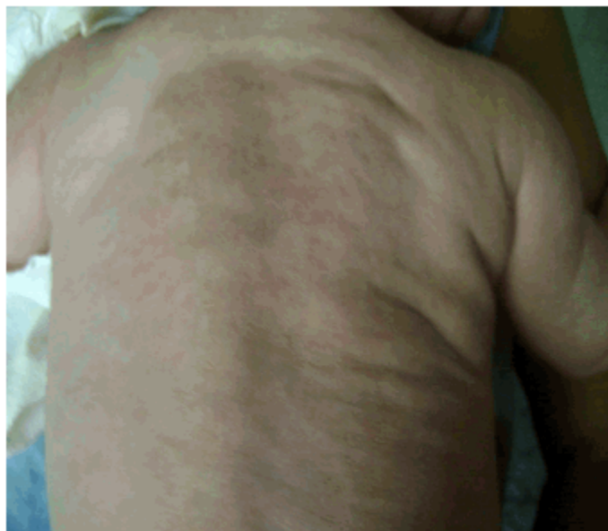
Figura 1. Región posterior del tronco, donde se observa placa infiltrada eritemato-violácea, de consistencia firme y superficie de aspecto abollonado.

Se observó cuadro cutáneo diseminado, constituido por placa infiltrada eritemato-violácea, de consistencia firme y superficie de aspecto abollonado, que asienta en región posterior del tronco, cubriéndolo casi totalmente (Figura 1). Se constataron además nódulos eritematosos a nivel de cadera derecha y región posterior de los muslos, cuyo tamaño oscilaba entre 1 a 3 cm. (Figura 2)