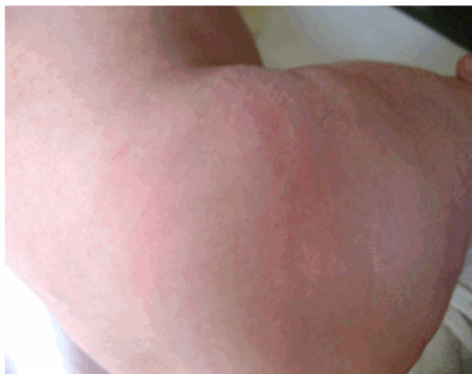
Figura 2. Nódulos eritematosos a nivel de cadera derecha.

Tejido celular subcutáneo: infiltrado, de consistencia firme y móvil, a nivel de lesiones cutáneas.