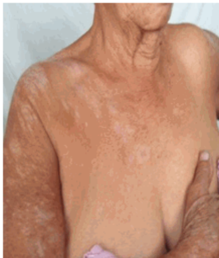
Figura 1. A. Lesiones en tórax y brazo derecho.

Lesiones maculares hipocrómicas localizadas en tórax anterior (Figura 1.A); abdomen y en espalda (Figura 1.B). Lesiones similares de mayor tamaño en superficie de extensión en miembros superiores, muslos y cara externa y pliegues de flexión de las piernas, algunas simétricas y bilaterales, entre 0,5 cm - 20 cm de diámetro; color marfileño o blanco porcelana, forma redondeada y otras ovaladas; de bordes bien regulares, definidos y algunos de ellos con un anillo a su alrededor ligeramente pigmentado; induradas con superficie algo atrófica y escamosa, blancas, pequeñas, de difícil desprendimiento, secas. (Figura 2.A). Otras placas con tapones queratósicos foliculares que simulan comedones (Figura 2.B); acompañado de prurito intenso, en paroxismos y sin relación ritmo ni horario.