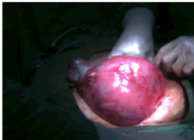
Figura 1. Imagen que muestra la extracción del útero de aspecto fibromatoso y con mioma.

Se realizó histerectomía total abdominal, anexectomía bilateral y apendicectomía complementaria. Se encontró útero gigante de aproximadamente 6 cm. de aspecto miomatoso. (Figuras 1 y 2).