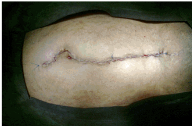
Figura 3. Imagen que muestra la incisión suturada.

Hubo de realizarse una amplia incisión para poder extraer el fibromioma. (Figura 3).