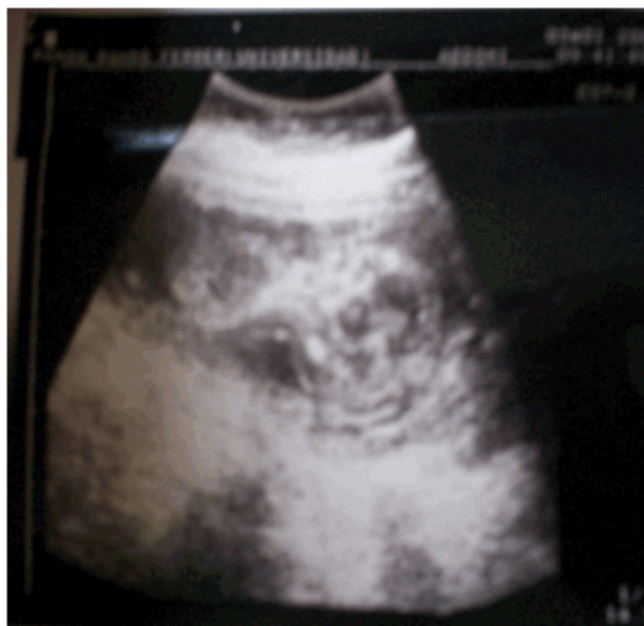
Figura 1. Imagen de una TN aumentada en producto con síndrome de Down diagnosticado prenatalmente.

El total de anomalías cromosómicas presentadas en la provincia en el período bajo estudio fue de 56, de ellas con una TN mayor de 3 mm se presentaron siete, que representan el 12,5 % del total, así como en el rango de valores de TN entre 2,5-2,9 mm, se encontró igual número de casos. La TN por debajo de los 2,4 mm se observó en el 60,7 % de las cromosomopatías y en 14,3 % (8 casos) no se conocía el dato específico, por no encontrarse registrado en la estadística del centro municipal, pero el USIT fue normal, por lo que en general el 75 % tuvieron TN normal.