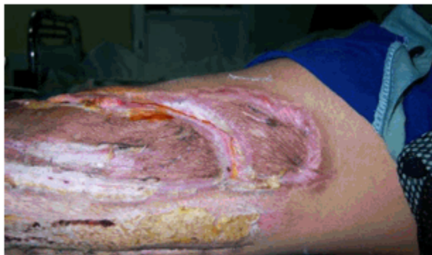
Figura 2 d) Resultado a las seis semanas.

Se revisaron las historias clínicas de los pacientes, informes operatorios e historia anestésica y se registraron las siguientes variables: sexo, color de piel, grupos de edades, tiempo entre ingreso y diagnóstico, enfermedades asociadas, focos clínicos de infección, gérmenes aislados, número de reintervenciones, estadía hospitalaria y mortalidad.