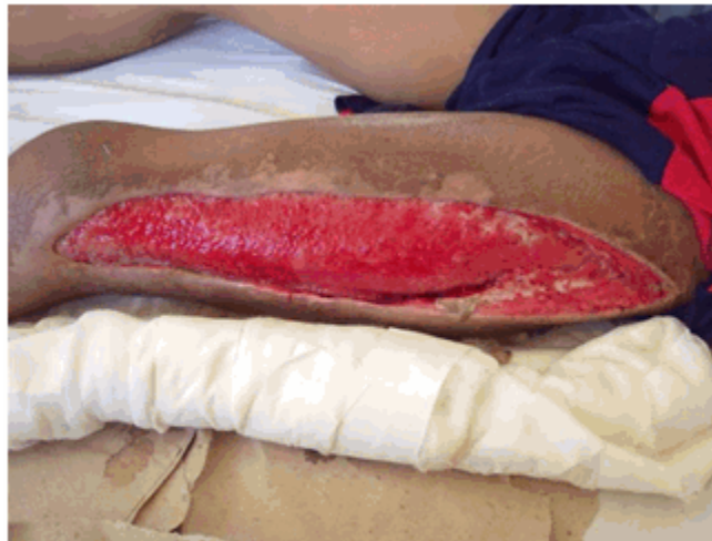
Figura 1. Fascitis necrosante. Control de la infección y presencia de tejido de granulación limpio.