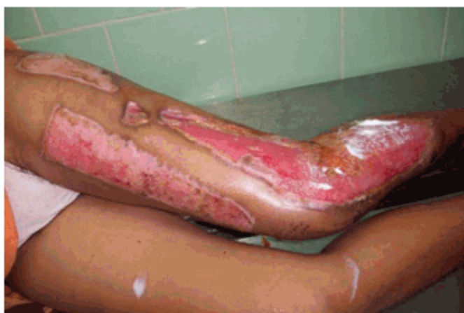
Figura 3 a) Fascitis necrosante de la pierna en fase granulación

necrosado varió entre cuatro y nueve veces. El 90,9 % de los pacientes necesitaron auto u aloinjerto de piel mallada, en dependencia de la extensión del área a injertar. (Figura 3a,b,c)