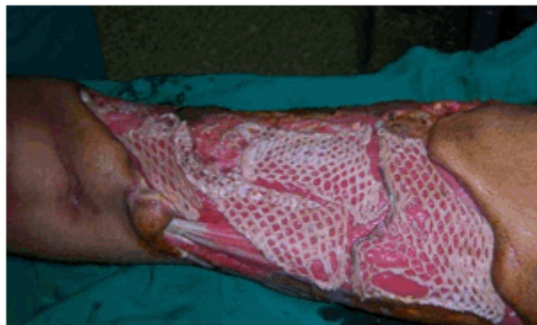
Figura 2 b) Aloinjerto de piel mallada en cara anterointerna del muslo derecho