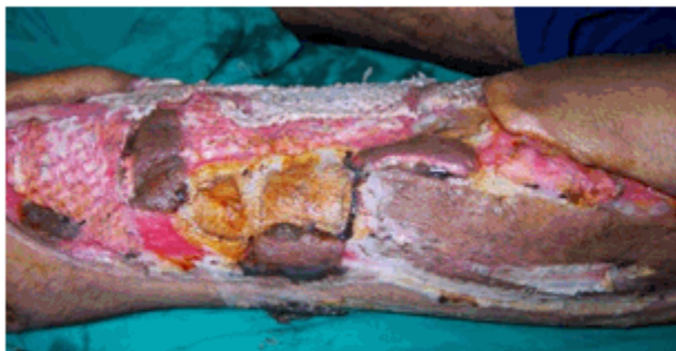
Figura 2 c) Dos semanas de tratamiento