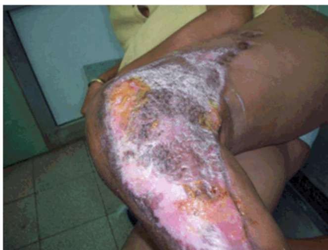
Figura 3 c) Resultado final

La estadía hospitalaria fue de 37 días ( 28,4 \pm 9,1 ) y la mortalidad de 9,09 %, pues solo falleció un paciente a consecuencia de la sepsis severa que provocó fallo multiorgánico.