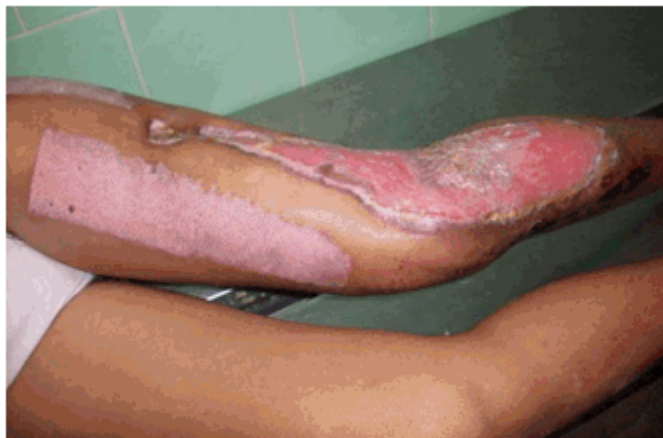
Figura 3 b) Tercera semana de tratamiento