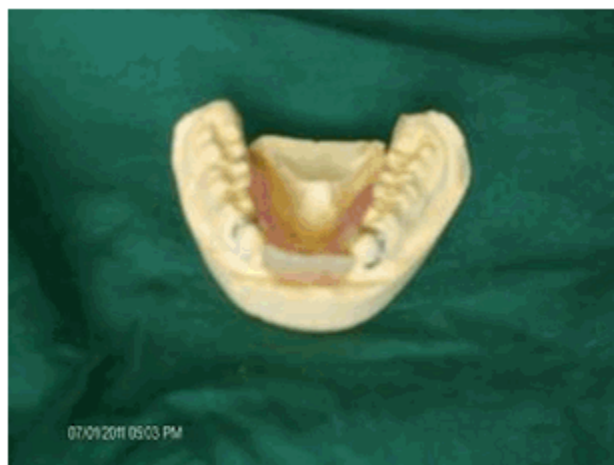
Figura 2. Prótesis parcial deacrílico inferior del primer caso.

Apoyados en la cooperación del niño y sus