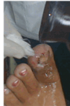
Figura 17. Lavado de la lesión

Se le indicó tratamiento con azitromicina 125 mg (1 cap. cada 12 horas) por 7 días.