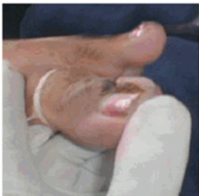
Figura 6. Hemostasia por barrido.

Seguidamente de conseguir la isquemia se realizó un corte longitudinal del lateral externo de la uña encarnada, que se extendió desde el borde distal del dedo hasta la zona de la raíz ungueal. Esta técnica se realizó siempre con el filo del bisturí hacia arriba y cuando se llegó a la cutícula se hizo una ligera rotación hacia la placa ungueal para penetrar por debajo de esta sin dañarla (Figura 7). A continuación se utilizó una sonda acanalada o explorador para separar las porciones ungueales seccionadas y liberarlas (Figura 8), finalizando con la extracción de la espícula ungueal mediante una pinza mosquito recta o curva. 9,11,12,14 (Figura 9).