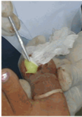
Figura 14. Colocación de la mecha