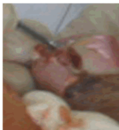
Figura 2. Imagen que muestra mamelón unilateral de aproximadamente 0,5 cm de diámetro circular, que presenta una hipertrofia que cubre la lesión.

En la consulta de podología se observó onicocriptosis unilateral externa de la uña del primer dedo del pie izquierdo, con tumefacción, enrojecimiento, aumento de la temperatura local, tumoración y dolor. Existía mamelón unilateral de aproximadamente 0,5 cm de diámetro circular, que presentaba una hipertrofia cubriendo la lesión. No existía dolor en la zona, la consistencia era blanda a la palpación, que provocaba un leve sangrado. (Figura 2).