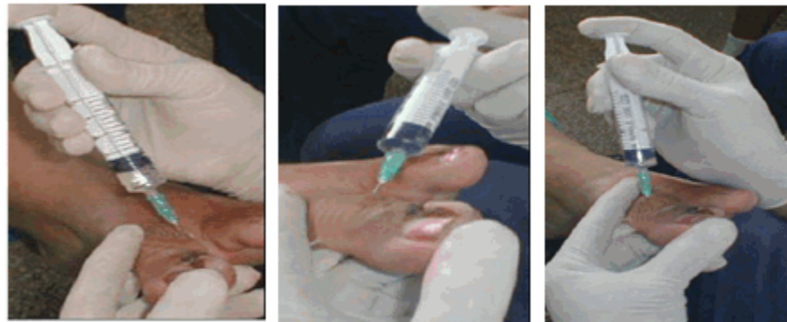
Figuras. 3, 4 y 5. Muestran la técnica de bloqueo del primer dedo.

Se realizó bloqueo anestésico con infiltración troncular en forma de H, utilizando lidocaína al 2 %, a dosis de 1cc por cada infiltración. (Figuras 3, 4, 5).