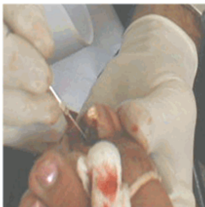
Figura 7. Corte longitudinal del lateral externo de la uña encarnada.