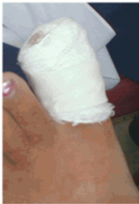
Figura 15. Vendaje