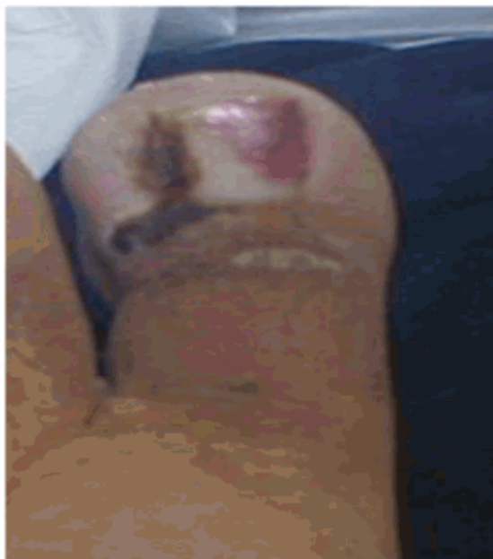
Figura 1. Imagen que muestra onicocriptosis unilateral con granuloma piógeno

Al examen físico se constató onicocriptosis unilateral con granuloma piógeno. (Figura 1).