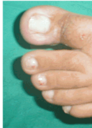
Figura 21. Evolución a los 10 días

La segunda cura se realizó a las 96 horas. Se descubrió la lesión, se examinó el estado de evolución y se procedió a realizar una cura seca con alcohol 75 % (Figura 20). Se le indicó continuar con las curas durante 10 días.