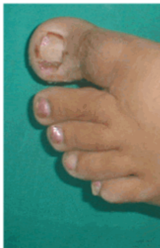
Figura 20. Segunda cura.

La segunda cura se realizó a las 96 horas. Se descubrió la lesión, se examinó el estado de evolución y se procedió a realizar una cura seca con alcohol 75 % (Figura 20). Se le indicó continuar con las curas durante 10 días.