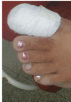
Figura 19. Vendado.