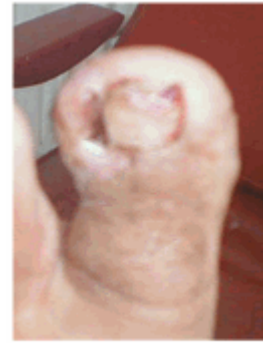
Figura 16. Lesión descubierta.