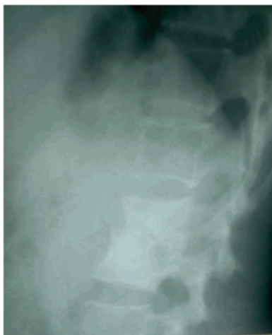
Figura 3. Radiografía de columna lumbosacra desde una vista lateral.

Se concluyó el diagnóstico como tuberculosis extrapulmonar (mal de Pott).