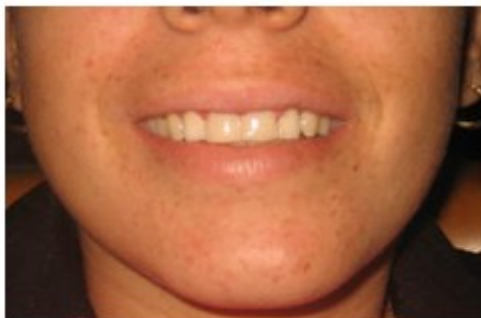
Figura 8. Imagen que evidencia la restauración estética de los dientes 11 y 21 con devolución a los dientes de su aspecto natural.