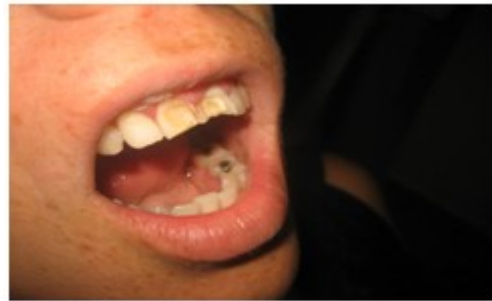
Figura. 3. Se observa en esta imagen el aspecto blanco calcáreo después del grabado ácido.

5. Seguidamente se aplicó el bond con un pincel delgado, fotopolimerizándolo durante 30 segundos.