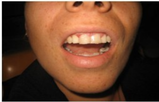
Figura 5. En esta imagen se muestra el exceso de material.

7. Se eliminó el exceso de material en torno al margen antes de polimerizar la resina.