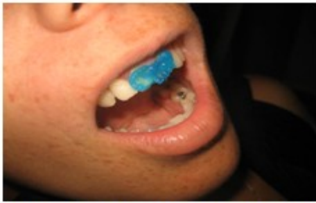
Figura 2. Imagen en que se observa el grabado ácido con aislamiento relativo en 11 y 21.