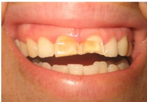
Figura 1. Imagen que muestra pérdida del tejido dentario en 11 y 21 con dentina expuesta. Hipomineralización de 11 y 21.

Diagnóstico clínico: hipomineralización del esmalte.