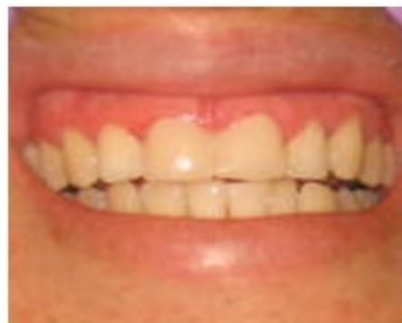
Figura 7. Imagen que muestra el aspecto de los dientes 11 y 21 después del pulido final.

8. Después que polimerizó el material, se quitó la matriz, se exploró cuidadosamente el margen y se eliminaron los excesos con fresas de diamante. El acabado se realizó con discos de pulido de grano fino, gomas abrasivas del kit de pulido. Por los espacios interdentarios se pasaron tiras de pulir, pero sin destruir la relación de contacto. (Figuras 6 y 7).