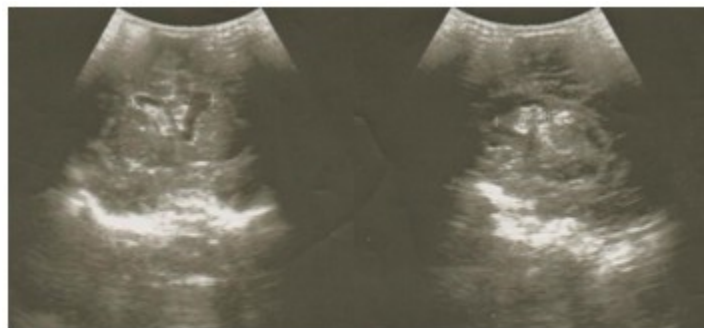
Figura 1. Imágenes ultrasonográficas que muestran corte coronal y sagital utilizando como ventana acústica la fontanela anterior. Se observa imagen ecogénica irregular localizada en la región subependimaria derecha.

Posteriormente el paciente fue enviado al Servicio de Imagenología donde se le realizó estudio ultrasonográfico transfontanelar con múltiples cortes en los que se observó una imagen ecogénica hacia la región subependimaria e intraventricular derecha. (Figura 1).