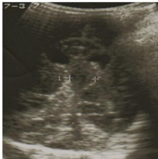
Figura 4. Corte coronal de ultrasonografía de control a los 5 días que revela mejoría imagenológica con reducción del tamaño de la lesión.

Se decidió realizar control evolutivo mediante ultrasonografía transfontanelar, visualizándose mejoría imagenológica de la lesión descrita. (Figura 4).