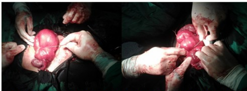
Figura 2. Tracción gentil de las suturas. Los extremos derecho e izquierdo se anudan en el fondo uterino de manera independiente.