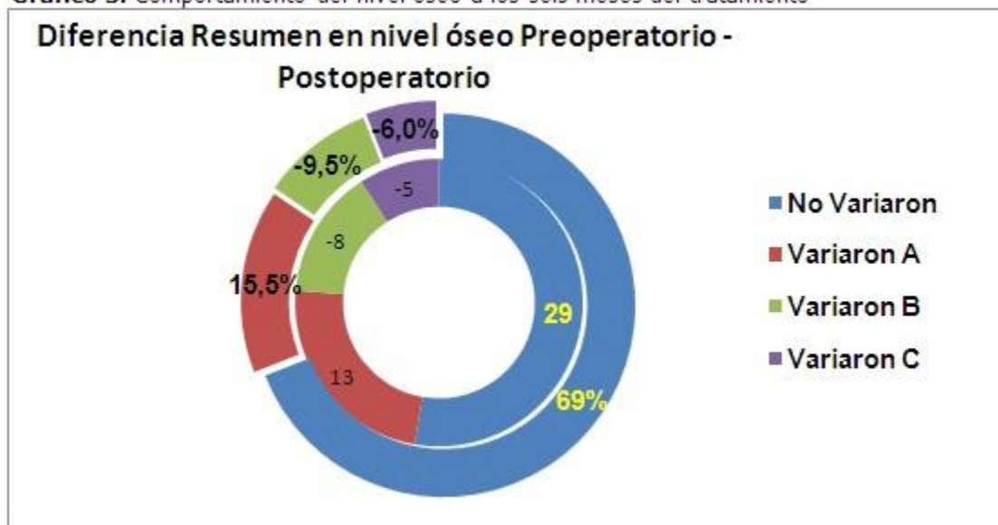
Gráfico 3. Comportamiento del nivel óseo a los seis meses del tratamiento

A: En el tercio cervical de la superficie radicular B: En el tercio medio C: En el tercio apical