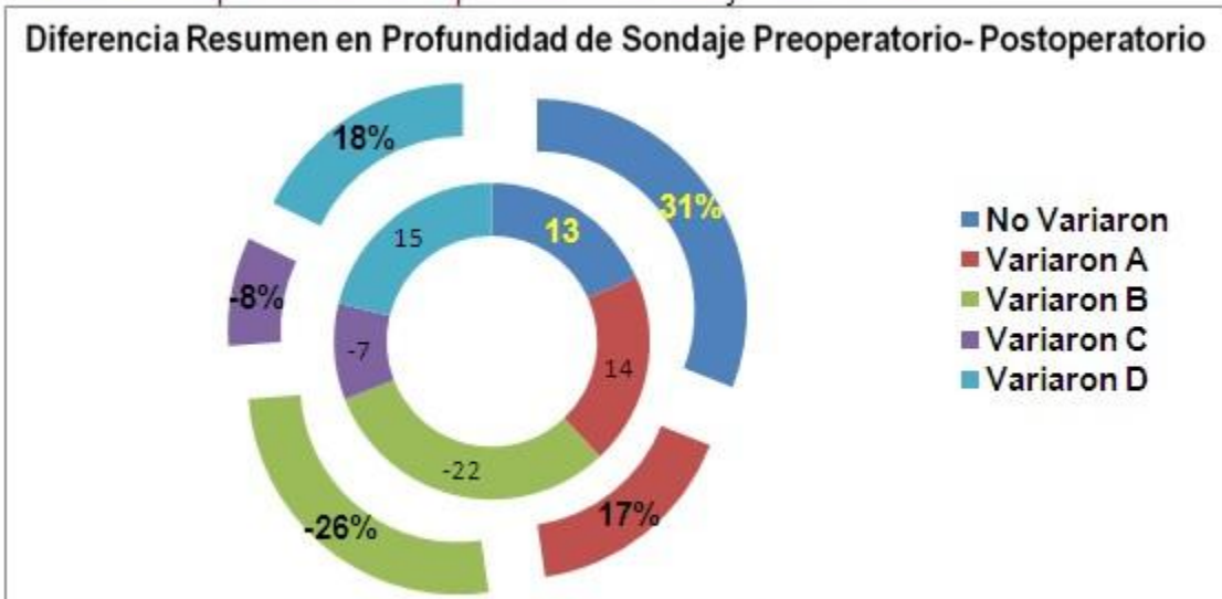
Gráfico 1. Comportamiento de la profundidad al sondaje a los seis meses

A: Profundidad al sondaje de 4 mm B: Entre 5 y 6 mm C: Mayor de 6 mm D: Menos de 4 mm