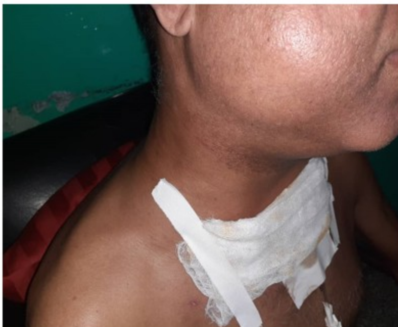
Fig. 2. Imagen que muestra el edema facial.

Posteriormente a las 48 horas de su egreso el paciente comienza con aumento de volumen de toda la cara el cuello y región supraclavicular. Se constata al examen físico presencia de enfisema celular subcutáneo. (Figura 2).